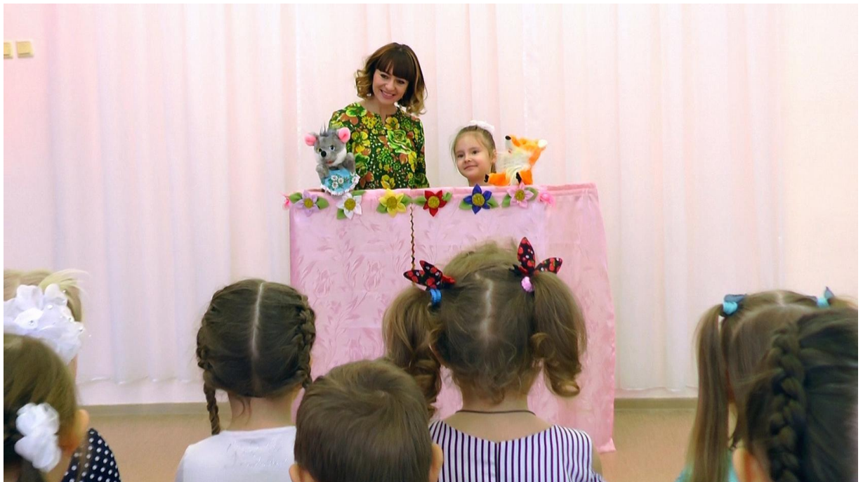
Театрализованная деятельность «Лиса и мышка»