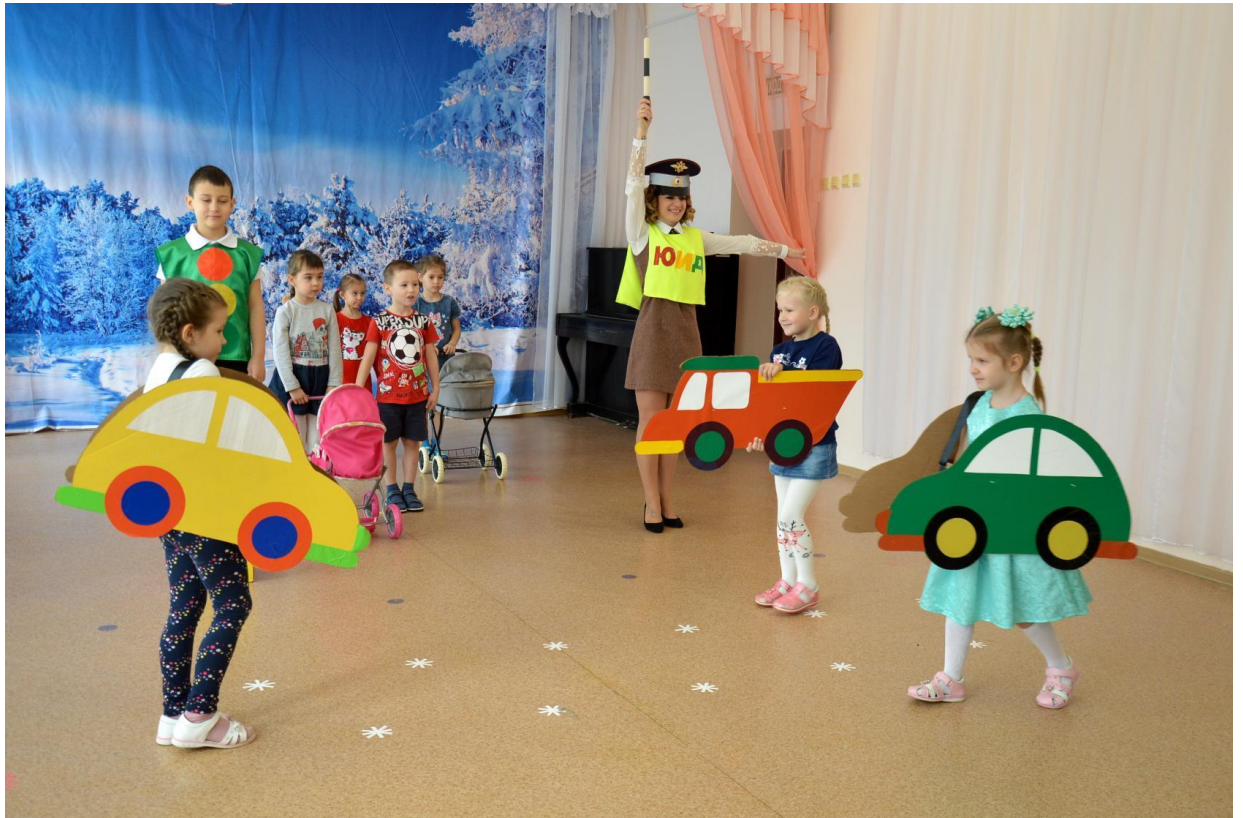
Образовательная деятельность по правилам дорожного движения «В гостях у светофора»